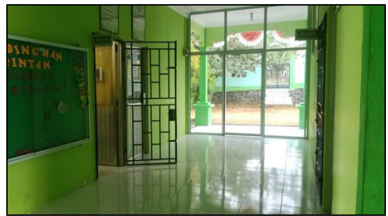
Pintu Masuk Bagian Depan