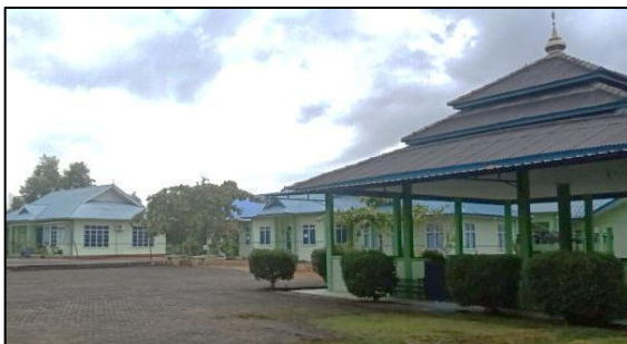
Mushalla MAN Bintan