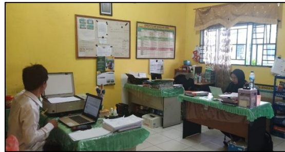
Ruang TU MAN Bintan