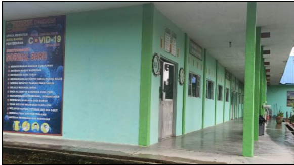
Gedung Belajar Bagian Depan