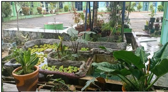
Taman MAN Bintan